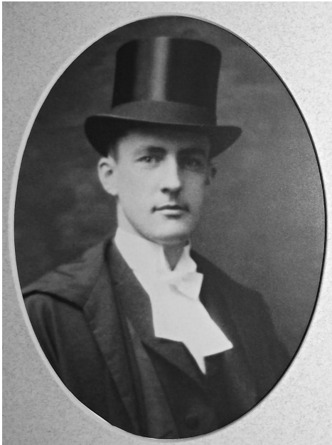
J. Leonard O'Brien en 1925-26, élu président de la Chambre des représentants de la Chambre à l'âge de 30 ans.